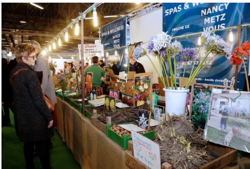
Vente de bulbes et rhizomes de fleurs sur Pôle Jardin • Hall B