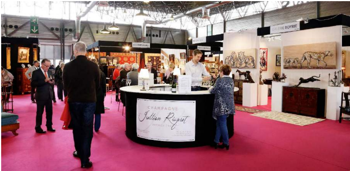
Bar à champagne sur le salon des ANTIQUAIRES • Hall A

Grâce à une sélection rigoureuse, les exposants du Salon des Antiquaires répondent à tous les critères d'exigences participant ainsi à la pérennisation de ce salon, gage de sérieux et de qualité.